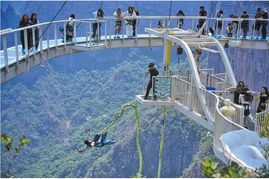
飞越宝泉。