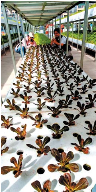
国家战略下的农业新地标——中原农谷。