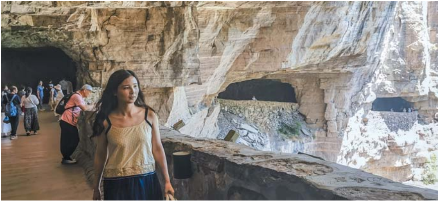
红岩绝壁长廊——郭亮洞。挂壁公路建于上世纪70年代,历时5年多,是一条人工开凿的隧道。