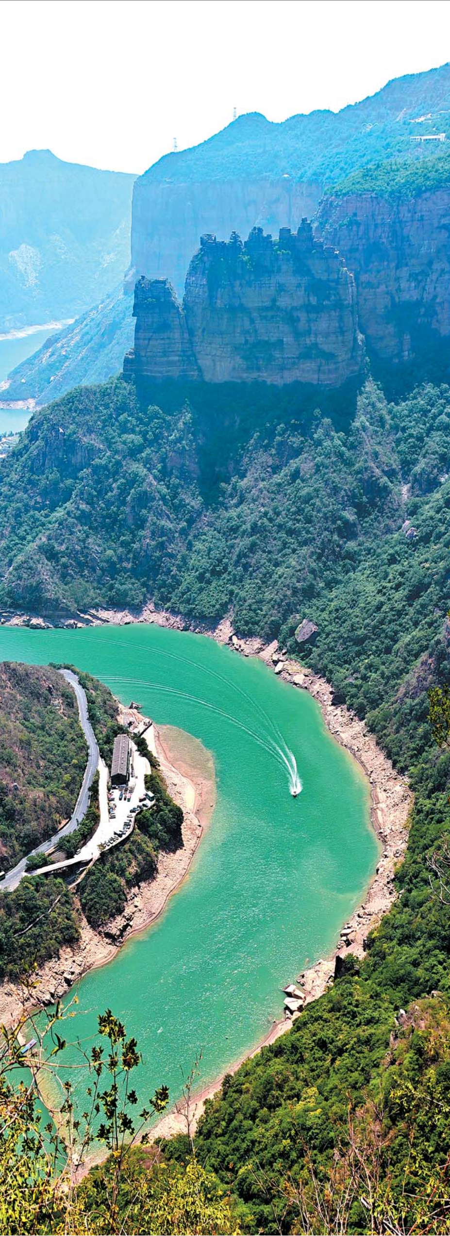
潭头水力发电站,坐落在风景如画的宝泉景区内。