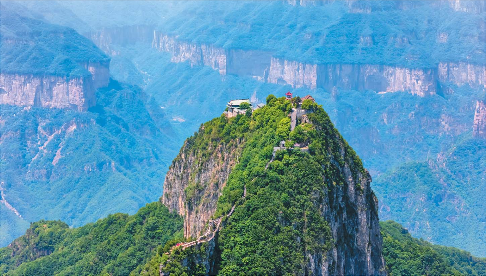
辉县市回龙老爷顶。