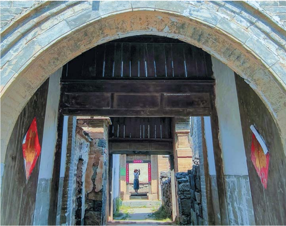
参观卫辉市狮豹头乡小店河村明清古建筑群。