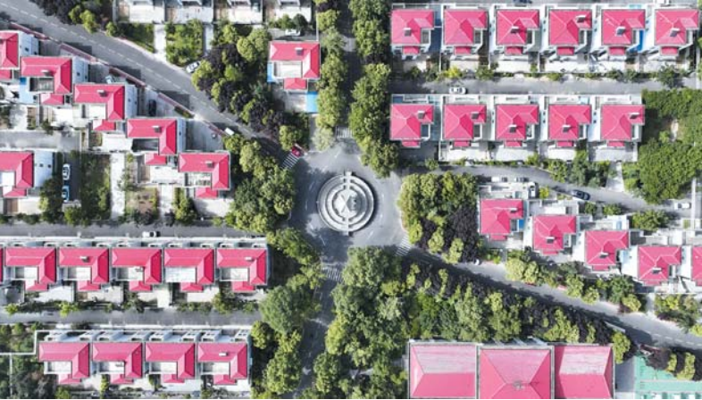
全国乡村治理示范村,新乡县翟坡镇朝阳社区。