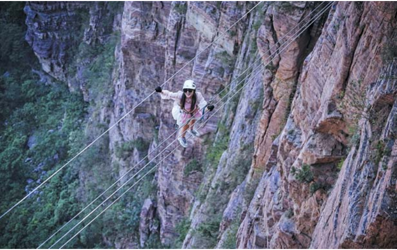
宝泉,崖天下。