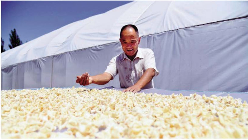
邹城石墙镇张楼片区生产的玉木耳。

顺应片区打造，邹城市通过“跨村联建”，成立片区党委14个，片区内村集体经济总收入实现5700余万元，带动近3000名村民家门口就业，平均增收6200元。