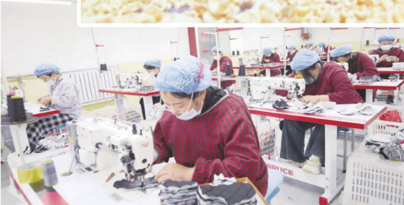
片区内村民在家门口的服装加工项目中就业。