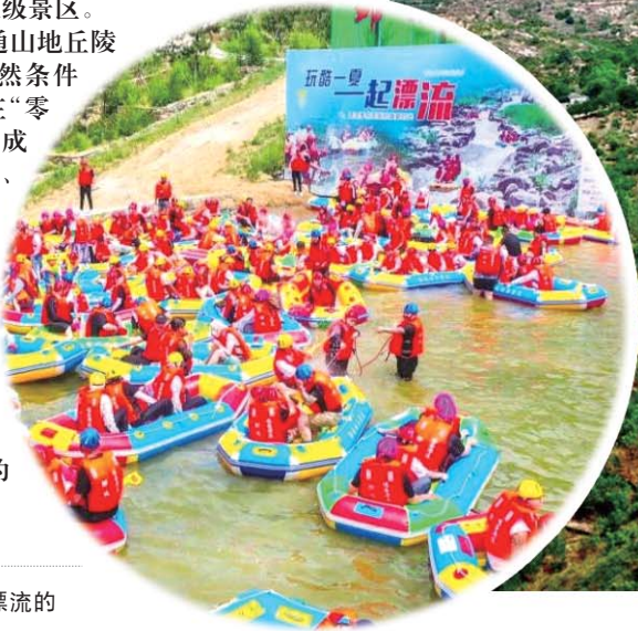
邹城城前镇越峰片区内峡谷漂流的中外游客。

2023年以来邹城市打通山地丘陵乡村振兴“整齐划一”受自然条件制约不便推进，靠单个村庄“零敲碎打、各自为战”又形不成合力的“卡点”。把区位相临、道路相通、产业相似、风貌相近的若干个村庄整合成一个片区，统一谋划、一体推进。三年的时间，全市成功打造了38个各具特色的乡村振兴片区，其中2个片区顺利进入省级示范片区行列，邹城也成为全省首批拥有2个省级示范片区的市(县)。