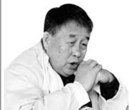
张书斌:中医世家,原国家领导保健小组成员、中国四小名医之一、中国糖尿病防治中心主任、糖尿病内病外治领域权威。获多项科技成果奖,并享受国务院特殊津贴,素有“红色御医”之称!

如果您想不打针不吃药,远离并发症,像健康人一样吃喝无忧的生活,请拨打专家团队公益咨询热线:0539-8884293 15725396573,免挂号费、专家咨询会诊费,免费获取帮助的同时,还可领取一本价值28元的糖尿病内病外治权威书籍,还有机会获得中国糖尿病防治中心价值数千元的规范诊疗补贴款。