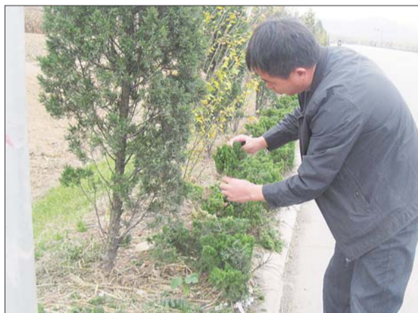
8日上午9点,东港区公路局工作人员手拿被盗剪的龙柏。

8日上午,东港区公路局抓获了2名盗取苗木者。进入11月份以来,该局共发现十余起盗取苗木现象。其中6日3小时内劝阻8名盗取苗木者,追回苗木4000余株。