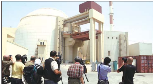
外拍照。记者在伊朗布什尔核电站反应堆 ▲图为2010年8月21日,摄影