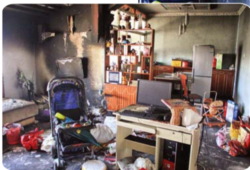
◀烧毁的家具一片狼藉。