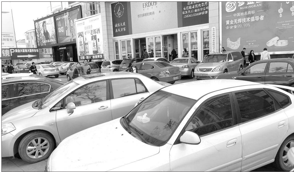
商业大厦门口,逛街的市民在车丛中寻路。

交管部门表示,马路两侧的停车位属于临时停车区,车辆不得长时间停靠在马路两侧,一些市民为图方便将车辆长时间停靠在路边的临时停车位上,使道路人为地变窄,不但容易引起交通拥挤,影响路面车辆通行率,引发交通事故也难以界定。