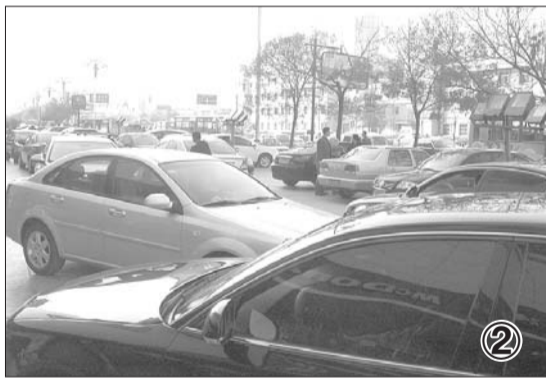
(本报稿件由本报记者 段学虎 见习记者 杨琼 联合采写)