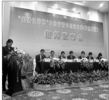
11月3日,创业大赛新闻发布会现场。