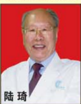
陆琦 痔科国宝 教授 中国肛肠学会顾问 组组长