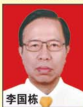
李国栋 主任医师 博士生导师 全国肛肠学会主任委员