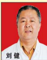
刘健 主任医师 中国肛肠病研究院委员 中医肛肠学会理事