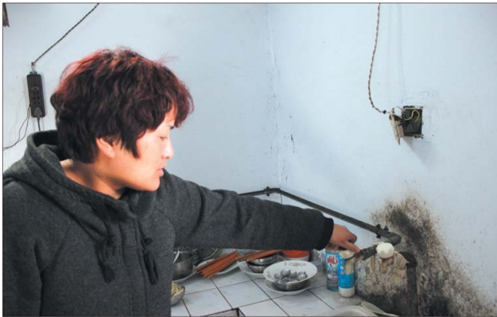
村民葛女士家每天只能接到半小时的水。

记者又走进村民宋女士家。“我们家的水也是断断续续,最近几天一点水也不滴了。”宋女士称,住在该片区域的村民,家里按时间供水,