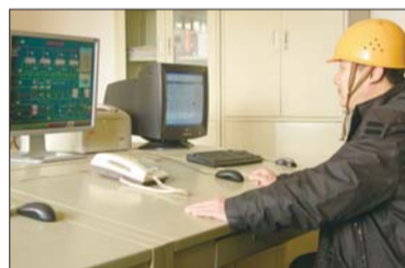
▲供暖首站工作人员时刻监控着供暖调试的运行状态。

张昌显告诉记者,为保障今冬供暖,供暖管网与国电厂4台蒸汽发电机组实现联网,将确保今冬供暖拥有充足的热源。而供暖首站的换热器、循环水泵等设备今年也都实现了改造更新。