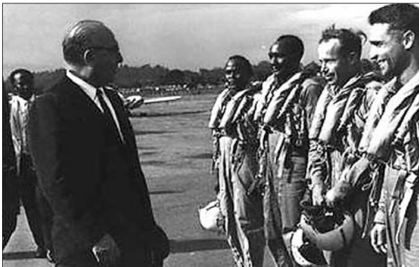
当时的以色列总理贝京(左)慰问胜利归来的飞行员。