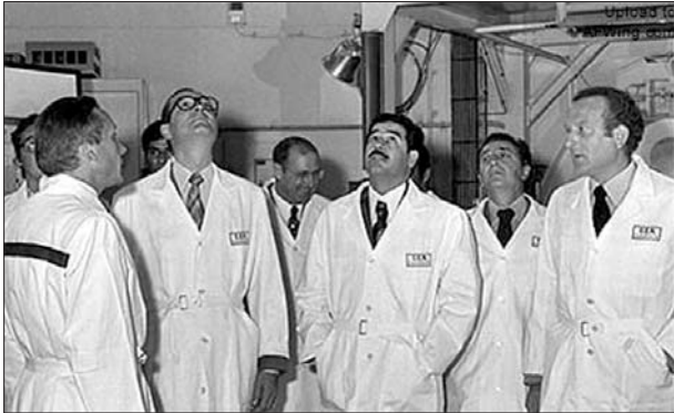
1975年,萨达姆(右三)在法国专家陪同下视察核设施。