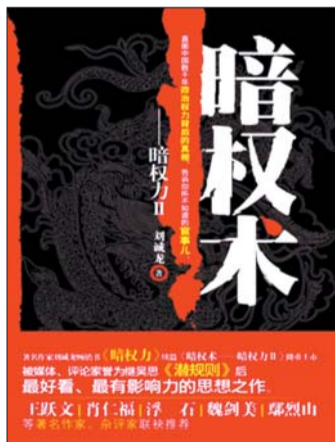
◆书名:《暗权术——暗权力II》 ◆作者:刘诚龙 ◆出版社:重庆出版社

郑庄公寤生,是个难产儿,出娘肚之际,把他娘折腾得死去活来,他娘因此很不喜欢他。他老弟是顺产,长得一表人才,庄公他娘老是在他爹那里吹枕边风,要他爹传位给他弟,但他爹耳根子不很软,遵守古制,传位给了庄公。他娘耿耿于怀,待他爹死,打定主意要搞一次“宫廷政变”。