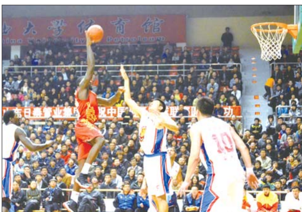
双方队员比赛中。

据悉,12日的比赛,山东男篮新赛季季前的最后一场热身赛,下周将打响CBA揭幕战,山东队将冲刺准备与佛山男篮的比赛。