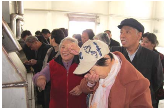
▲精选玉米胚芽散发出浓浓的香甜味