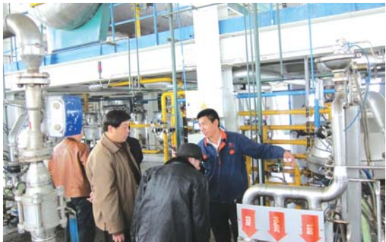
▲国际领先的精炼设备让读者代表们惊叹不已