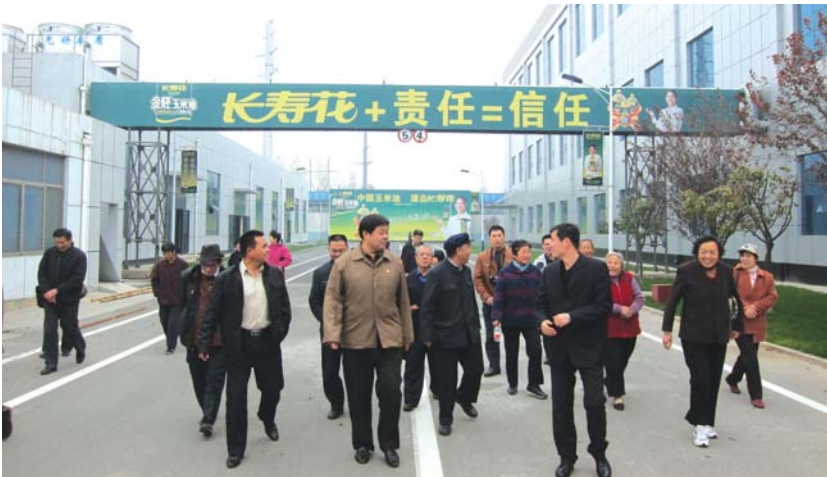
▲30名读者代表走进长寿花实地考察

长寿结下了不解之缘,在中国玉米油多年的发展历程中,“长寿花”始终坚持科技创新,精工细作,用金牌品质确保为广大消费者提供营养健康产品。长寿花金胚玉米油产品以“关注心脑血管,三低更健康”的核心产品诉求,不断挖掘和发展金胚玉米油的健康长寿功效,为消费者生产绿色、安全、营养、健康的长寿花玉米油。为国人生产绿色安全健康的玉米油是三星企业多年坚持的永恒信念。