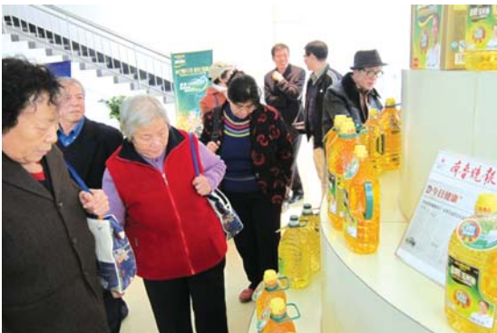
▲琳琅满目的长寿花玉米油产品吸引了大家