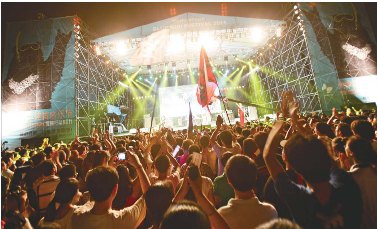
迷笛音乐节现场,摇滚引爆现场乐迷。