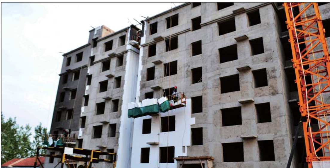
学苑路公租房近期正在进行外墙保温材料覆盖工作。

通过持续关注,我们向读者传递,“宜居”在日照,体现的不仅仅是生态环境好,更是对当地的老百姓和外来务工人员“居者有其屋”的承诺和践行。