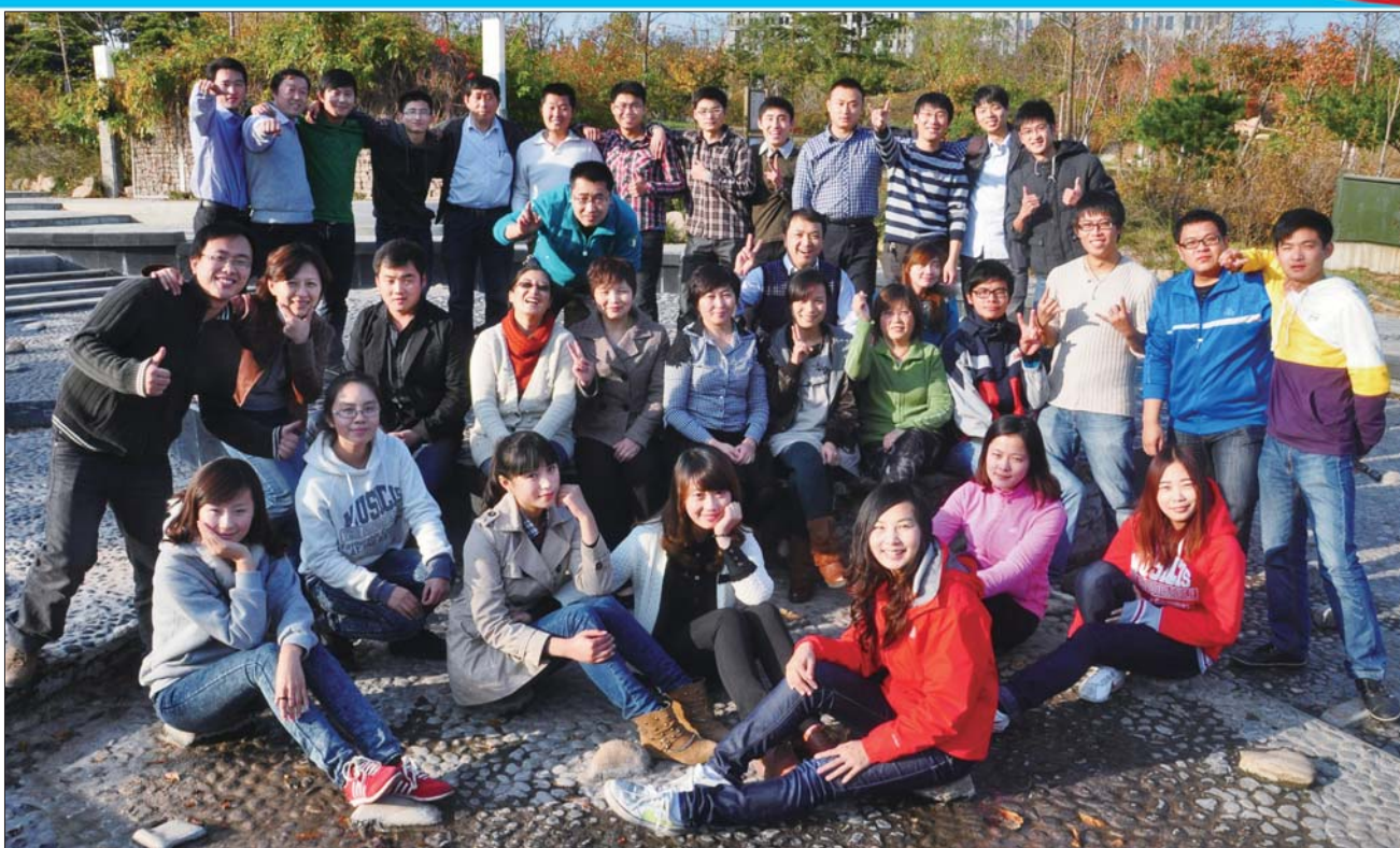
我们的全家福。