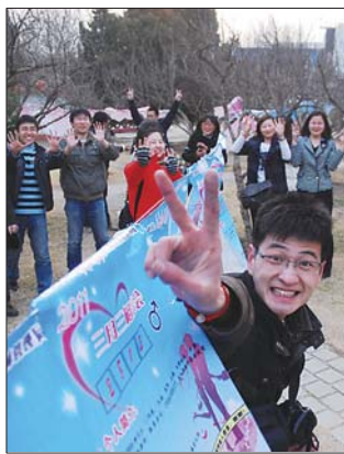
2011年“三月三相亲会”活动合影。