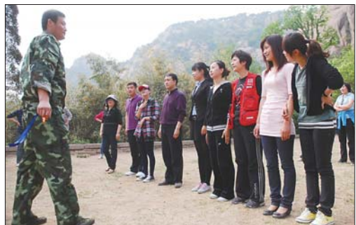
2011年6月,本报员工在九仙山进行拓展训练。