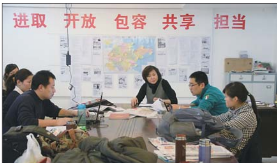
2011年1月,本报编辑部召开“两会”报道会议。