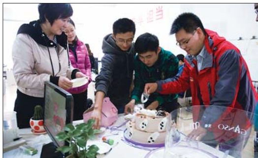
2011年记者节,安利日照分公司的工作人员给本报编辑部送来蛋糕共庆节日。