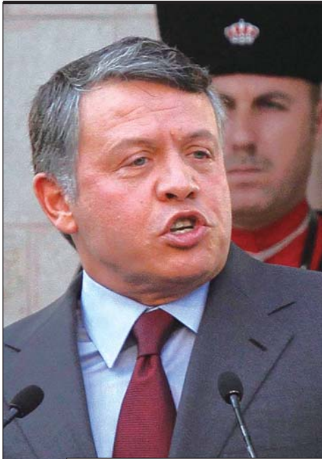
◀约旦国王阿卜杜拉

11月14日,约旦国王阿卜杜拉发表讲话敦促叙总统巴沙尔·阿萨德辞职,他是第一位公开要求阿萨德下台的阿拉伯国家领导人。同一天,阿盟宣布将派500名观察员赴叙,叙政府对此表示欢迎。