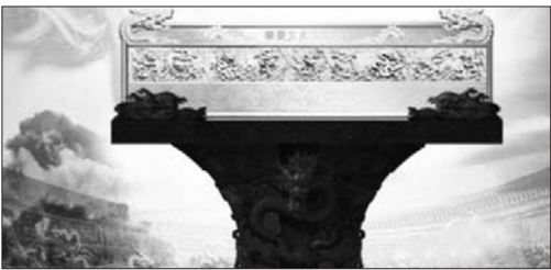
中国黄金·华夏五九至尊金。

“华夏五九至尊金”成匚状,长99.999厘米,宽26厘米,厚1.8厘米,重约200斤。俗语云“金无足赤”,但“华夏五九至尊金”纯度高达99.999%,是目前世界上最纯最大的金条。展品使用纯手工雕刻打磨的工艺方式,融汇了中国传统文化和99.999黄金更赤、更纯、更值的三大特色,极富艺术价值,已荣获吉尼斯世界纪录。 正面铸有“华夏五九至尊金”字样,壁面有9条形态各异、奔腾在云雾波涛中的蟠龙浮雕。龙形体态矫健、气势雄劲、栩栩如生,并有山石、海水、流云、日出和明月图案环绕,好似飞龙从天而降、腾云驾雾,尽显盛世之征、至尊之象。 背面铸有中国黄金logo、至纯金logo、中华人民共和国99.999高纯金国家标准纪念发布字样。 因世茂百货周年庆,“华夏五九至尊金”此次特来烟巡展,希望想一睹其风采的市民朋友届时到世茂百货观赏。