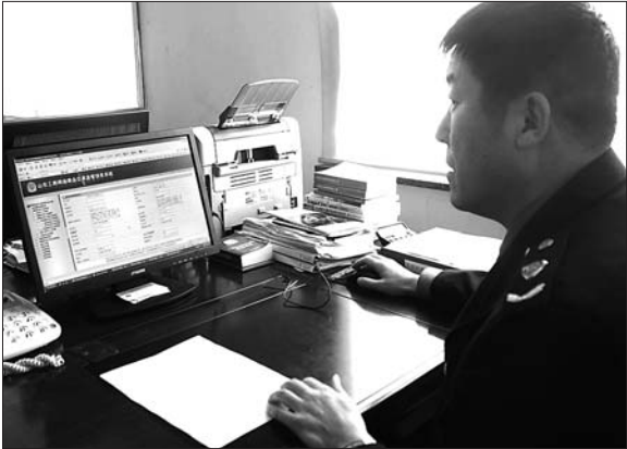
▲东港工商分局的工作人员正在通过山东工商网络交易管理系统对日照市的网络商业行为进行监管。