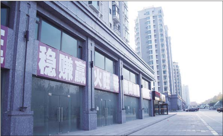
济南路一楼盘打出了商铺出租广告。

记者走访多家楼盘发现，多数楼盘的沿街商铺都已销售结束，剩余的商铺也只是因位置不佳受到冷落，而在老城区一家楼盘，虽然项目刚开始动工，但记者在接待处了解到，虽然房子还没有开始销售，但是沿街商铺早就被预定一空。 “商铺一直就不愁卖。”在泰安路一楼盘售楼处，销售负责人告诉记者，一个楼盘所开发的沿街商铺数量十分有限，许多商铺都是在内部就被预定，买个商铺有时候得动用不少“关系”。 一业内人士认为，商铺卖得好不好也要看，一些位置相对较偏的商铺卖得不一定就好，而像一些商圈已经成熟的商铺，或是未来周边有好的规划的商铺最受购房者青睐。