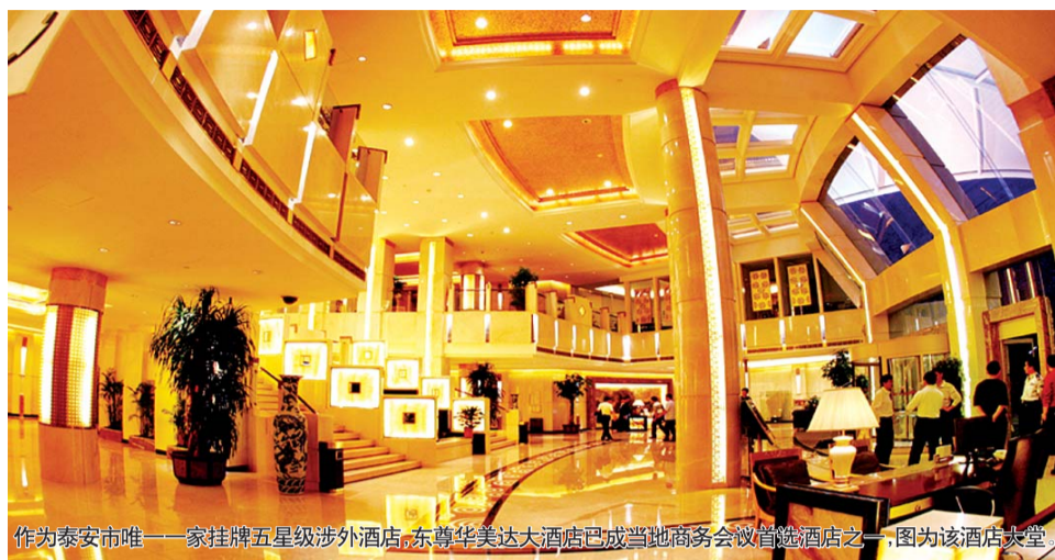
作为泰安市唯一一家挂牌五星级涉外酒店,东尊华美达大酒店已成当地商务会议首选酒店之一,图为该酒店大堂。

“由本报和山东省旅游协会联合主办的“山东最佳商务会议酒店评选”活动今日正式启动,这是山东省第一次以“商务会议酒店”概念对全省酒店进行评选。为更好地推动活动开展,营造全民参与的氛围,齐鲁晚报将对此次评选进行连续报道,并开通新闻热线,邀广大读者和商务人士积极参与互动并提供新闻线索。”