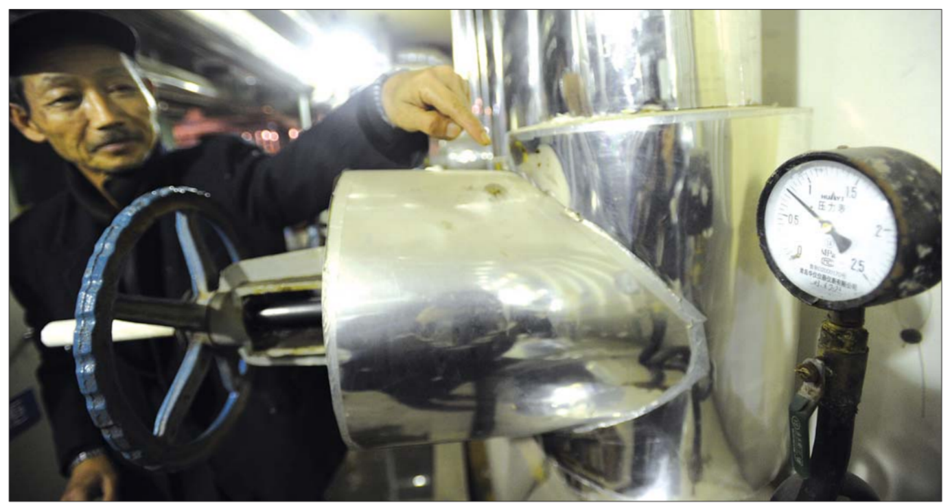
本报记者 王媛 摄 ▲二月9日,在济南历山路一小区的自管换热站内,压力表显示正常,为小区居民送去温暖。

本报11月16日讯 16日14时,济南市市政公用事业局局长贾玉良带领济南市供热办、济南热电、济南热力负责人做客齐鲁晚报,生活日报热线。两个小时内,共有207个电话“问暖”,其中不少涉及新建小区的供暖问题,而导致这些新建小区暖气不热的原因,有的是因为热源不足难入网,有的是因为供热设施不合格,还有的是被开发商忽悠了。 家住浆水泉路正大城市花园二期的市民韩女士打进电话反映,去年供暖质量不错,但今年到现在还没有热起来,不知是什么原因。对此,济南热力有关负责人说,正大城市花园二期原来热源已经稳定了,随着小区继续开发建设,自管站私自将新用户接入供热管网,将原来足够的热源分走了一部分,造成小区内很多户都不热了。“我们正在调整热源,让用户家都热起来。”这位负责人说,现在不少新建小区都存在这种情况。 另外,汇丽华城、文化园等新建小区的居民都反映,开发商已收取了开户费,但现在却无法正常使用供暖。济南市市政公用事业局供热办副主任李勉说,现在不少开发商为了卖