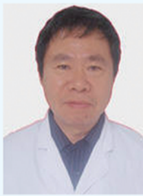
张家范 教授 主任医师 上海复旦大学附属瑞金医院泌尿科主任