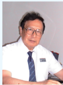
臧美孚 教授 主任医师、博士生导师 北京协和医院泌尿外科专家