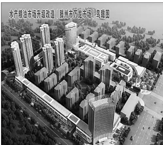
水产粮油市场升级改造(滕州市万龙市场)鸟瞰图