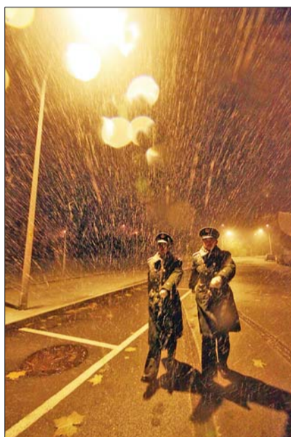
▲29日夜,密集的雪花滋润着这座城市,武警济南市支队官兵冒雪行走在执勤路上。