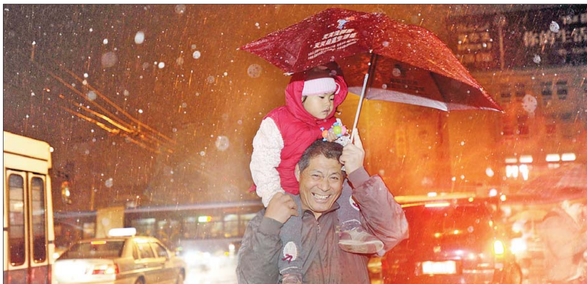
▲29日晚6点左右,市民们欣喜地在今冬首场雪中踏上回家的路。