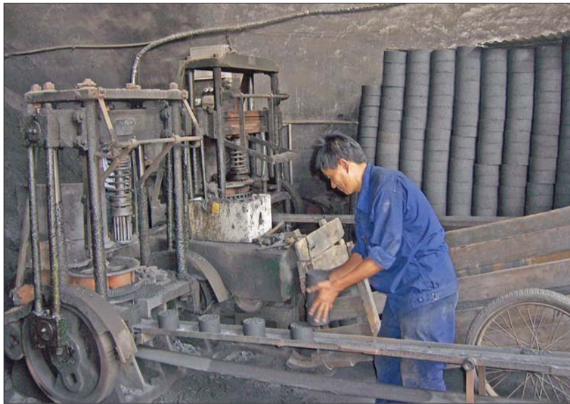
蜂窝煤最好还是从国营煤店购买(资料片)。

谈起制作蜂窝煤的材料,这位老板毫不讳言,“三毛八的是用料子兑的,五毛五的每斤里边有半斤煤、半斤料,七毛五的里边全是煤。”老板说,通常0.55元一块的卖得最好,0.35元一块的没法烧,至于他所说的料子到底是什么,这位老板则