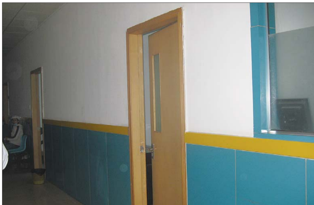
监测哨点门外没有挂牌,看上去和普通诊室并无区别。

作为艾滋病防控体系的重要环节,艾滋病监测哨点让人颇感神秘。监测哨点是做什么的,如何收集相关信息,如何跟踪高危人群,哨点监测能为艾滋病的流行趋势和变化提供怎样的支持?29日,记者探访泰安市中心医院的艾滋病监测哨点。