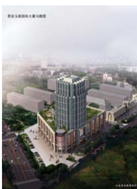
泰安玉都国际项目,位于泰城中心区域,东岳

大街以北,科山路以西,泰安汽车站对过,距离泰安市政广场不足1千米,项目具备较高的形象展示价值。同时,在吸引游客消费方面也具有较大的优势,商业价值较高。项目所在地紧靠泰安市长途汽车站,周边有多路公交线路,交通便利,商业氛围浓厚,位置优越。