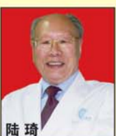
陆琦 痔科国宝 教授 中国肛肠学会顾问 组组长