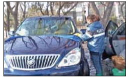
洗车店工作人员正清洗车辆

本报12月8日讯(实习生 毕倩倩 记者 任志方) 连续雨雪天气过后,12月8日,济南的天空终于见到了太阳。前几天雨雪天气带来的道路泥泞,使得大部分机动车都蒙上了一层灰垢。8日一大早,市区内各大洗车店就排起长长的队伍,不少洗车店的工作量和平时比翻了一番。