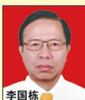
李国栋 主任医师 博士生导师 全国肛肠学会主任委员