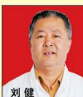
刘健 主任医师 中国肛肠病研究院委员 中国肛肠学会理事