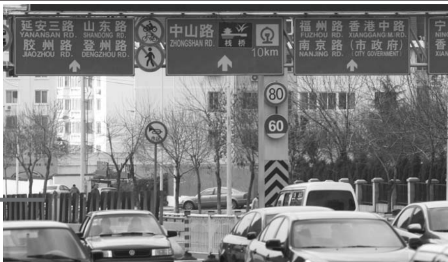
▲在银川西路设有不同标准的限速牌。

根据青岛市交警支队最新统计,截至2011年11月底,青岛全市共有682495起超速违法行为,平均每天有接近2100起。而据统计,早晚高峰期间,青岛市香港中路、山东路、南京路、福州路等道路的通行量饱和,平均车速仅有10公里/小时左右。一边是跑不快的道路,一边又是数目惊人的超速违法行为,青岛的车速,究竟是快不起来还是慢不下来?