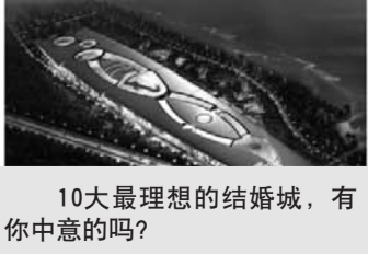
10大最理想的结婚城，有你中意的吗？