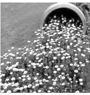
是谁打翻了一地的春天？

已知急流水速40m/s，木筏最快速度20m/s，江岸宽150m视作平行，木筏与岸边成45°向下游航行，求到下游对岸找君所在江上所用时间。