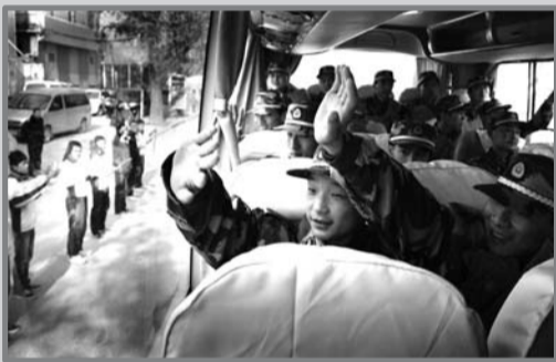
▶挥别亲人, 当兵去!