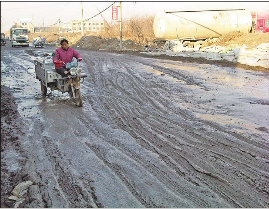
▲满路泥泞,让行人怎么出脚?

沿工业北路北侧从黄电大街路口向东走约400米有一条南北向的小路,由于每天有大量重型货车通过,路面损坏严重。给每天都要从这条路通过的市民带来了诸多不便。