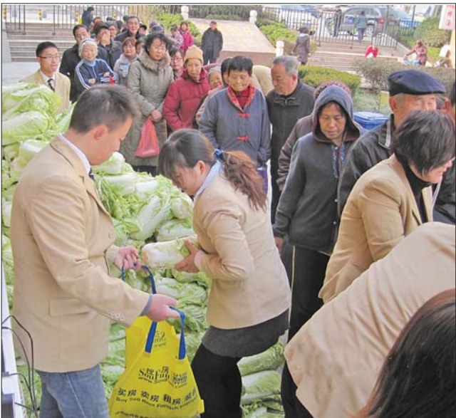
居民在排队领取白菜。

“这是好事情,我们不怕。”面对质疑,一位现场的负责人还告诉记者,自己的爷爷是位农民,对菜农的卖菜难深有感受,考虑应该帮帮他们,便从唐王蔬菜基地购买了一万斤大白菜,免费送给周边的居民。之所以要留电话号码,是为了现场发放秩序的需要,没有商业目的。