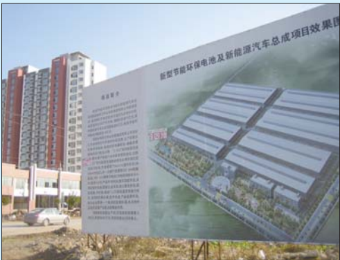
▲电池厂奠基的位置离东城国际小区很近。

位于枣庄市市中区衡山路的东城国际小区眼看就要交房了,可是本该十分高兴的小区居民最近却忧心忡忡,因为就在小区马路的对面,立起了一块电池厂的规划牌子。东城国际小区居民十分担心,如果真的建电池厂,肯定会造成环境污染。针对此事,枣庄市经济开发区管委会回应,电池制造的项目将另选地址,不会在该小区旁建设。