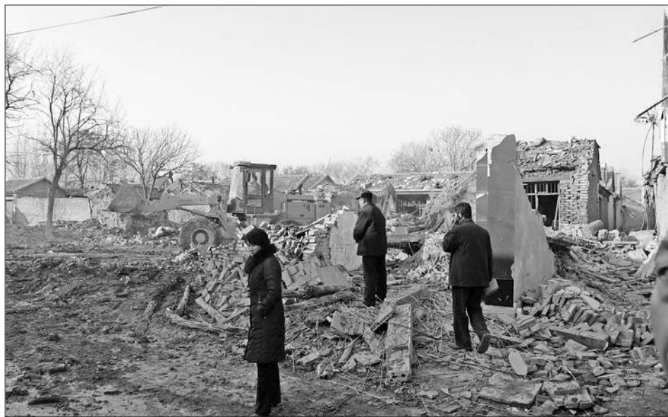
爆炸中,几间平房夷为平地。本报记者 常学艺 摄

据陵县有关负责人介绍,事故发生于15日中午12时20分,张祥金私自藏匿的烟花爆竹发生爆炸,造成自家砖土结构的房屋垮塌,多名亲友被埋,户主张祥金下落不明。事故发生后,陵县政府立即启动应急预案,组织公安、消防、医护人员开展救援工作,并调查事故原因。