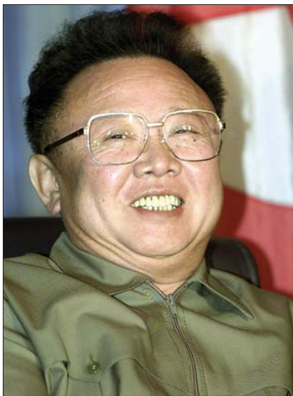
这是2002年8月23日,金正日在俄罗斯远东访问时的照片。