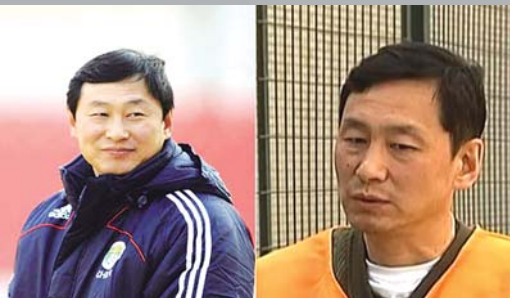
中国足协原专职副主席南勇