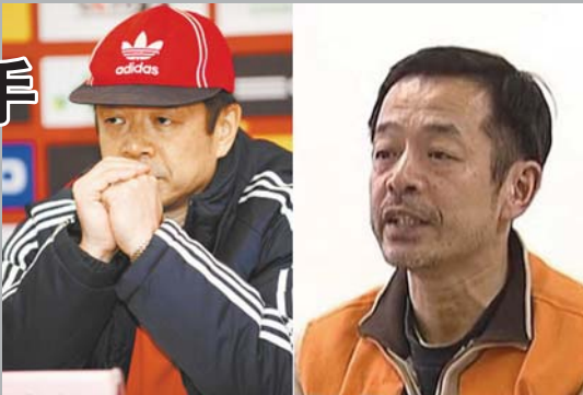
前国足领队蔚少辉

9000元左右。蔚少辉作为国足领队会有一些额外收入,比如国家队集训期间的津贴以及比赛奖金等,所有这些收入加起来,蔚少辉的年收入不过十几万元。