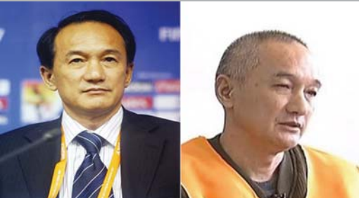
中国足协原专职副主席谢亚龙