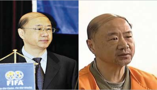
中国足协原技术部主任李冬生