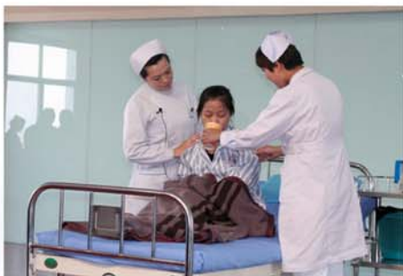
▲护士精心呵护患者。

凝练核心理念聚人心。一是医院大力推行文化建设,在总结传承和发扬医院原有的艰苦奋斗,团结和谐、科学严谨,真抓实干的文化基础上,创新提炼形成了具有持久生命力的医院新文化,营造了共同的思想理念、价值观念、行为准则和作风,用文化统一思想,将先进的文化转变为行为,转变成了医院的服务优势,质量优势和竞争优势;二是打造服务品牌树形象,医院高质量通过了全国百姓放心示范医院第三周期考核,倾心打造了全国百姓放心示范医院服务品牌,