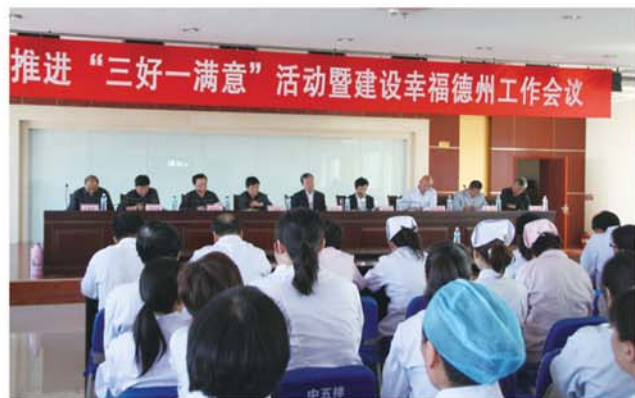
▲医院召开“三好一满意”活动暨建设幸福德州工作会议。