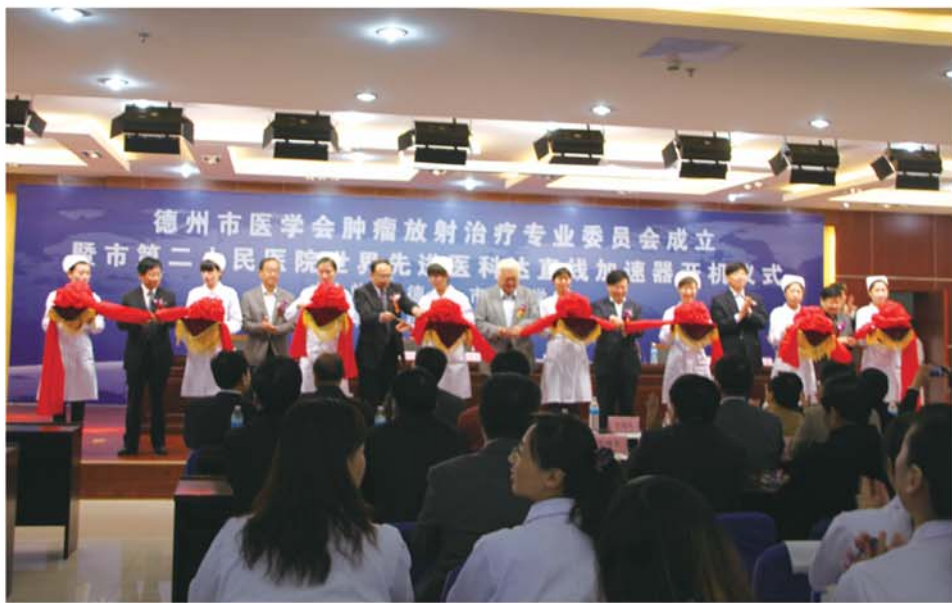
▲德州市医学会肿瘤放疗专业委员会成立暨医用直线加速器开机仪式。

院突出科技兴院的强院思路,重点在设备投入、学科建设、人才引进和培养及技术创新上下功夫,不断提升医院的综合技术实力。一是大力购进设备,投资3000余万元购置了瑞典医用直线加速器、血管造影介入治疗系统,德国螺旋16排CT机,美国彩色超声仪等,先进的设备带动了全院综合诊疗能力的不断提升;二是调结构、引人才,医院重视学科带头人的培养,实施中层干部竞聘上岗,全员聘用制及岗位绩效管理改革,人才上实行“送出去,请进来”的办法,聘请了多科临床经验丰富的老教授、老专家,其中天津肿瘤医院,中国医学科学院肿