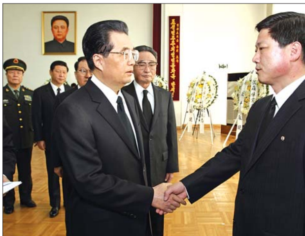
12月20日上午,胡锦涛前往朝鲜驻华使馆,沉痛吊唁金正日逝世。吴邦国、李长春、习近平等一同前往吊唁。