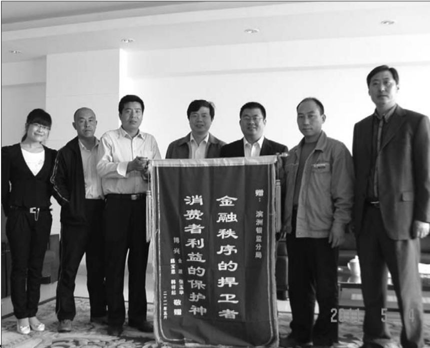
银监局收到了市民送的锦旗。(资料图)

近年来,滨州银监分局立足本地实际,在滨州市委、市政府的正确领导下,为地方经济平稳较快发展做出了巨大的贡献。工作中,银监分局还努力寻求与“黄河三角洲”开发和“蓝色经济区”建设的最佳结合点,为“黄蓝”战略的发展谱写了新的篇章。