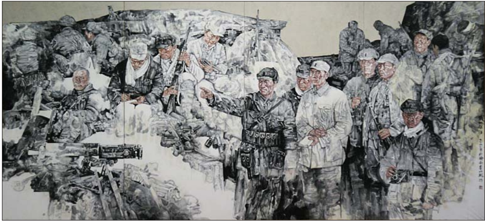
↑李兆虬 中国画《战地采访》