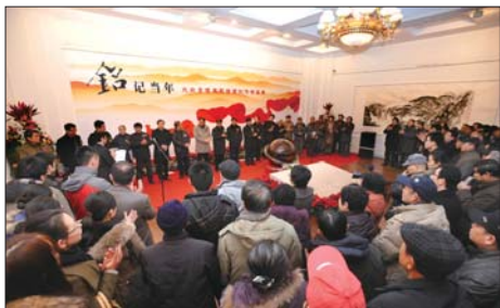
展览开幕现场

由大众报业集团主办、山东新闻书画院承办的“铭记当年——大众日报社主题绘画创作精品展”2011年12月30日上午10时在山东省美术馆隆重开幕。这次画展的特别之处在于，展出作品是以大众日报历史为题材，或者是专门为大众日报社创作的。 从刻画大众日报第一台印刷机的超写实油画《丰碑》，到群像雕塑《艰苦岁月》；从反映敌后编辑部的《沂蒙深处》，到表现当年一手握笔，一手拿枪记者形象的《战地采访》；从《大青山突围》的滚滚硝烟，到《走进城市》的动人场景……一幅幅艺术精湛的巨幅作品让观众流连忘返。大家表示，大众日报主题绘画创作精品展，不仅是一场视觉艺术盛宴，也是一次生动的革命传统教育。