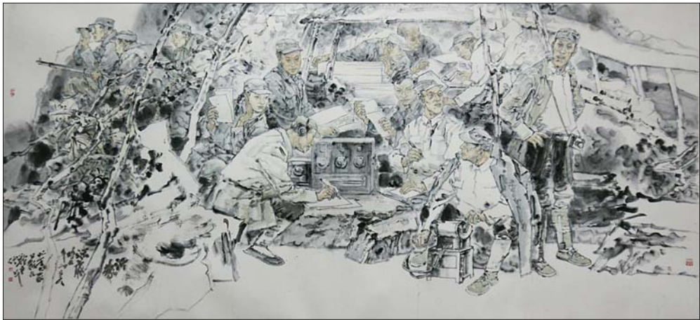
↑于新生 中国画《沂蒙深处》