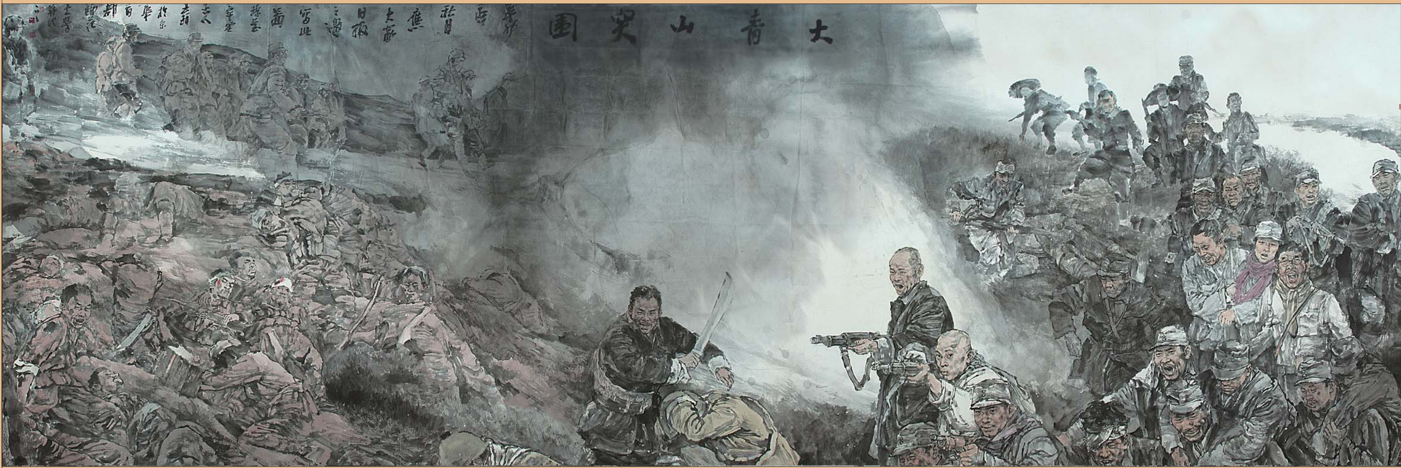
↑王珂 中国画《大青山突围》