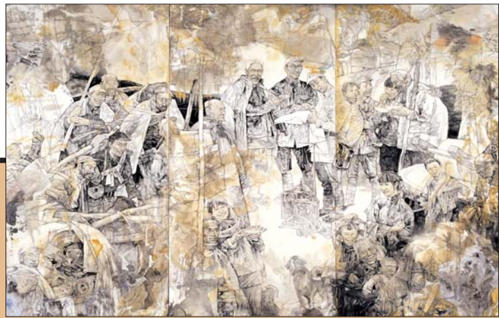
↑岳海波 中国画《鱼水情深》