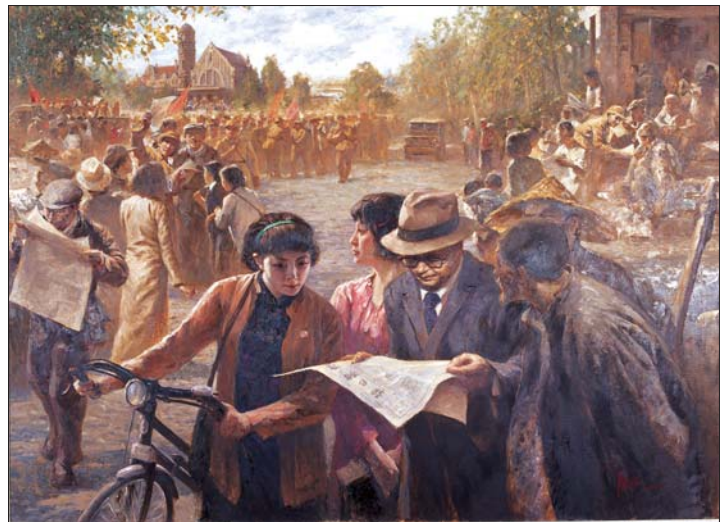
↑王庆裕 油画《走进城市》