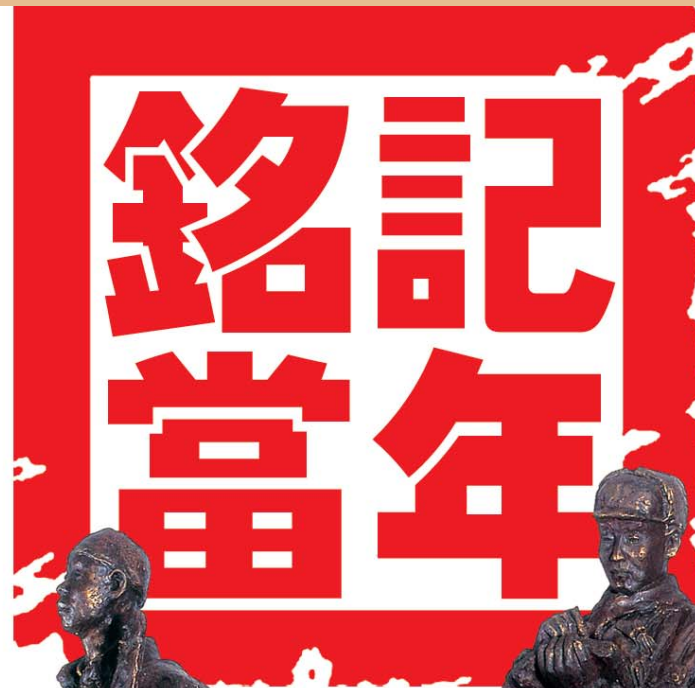
→仇世森 雕塑《艰苦岁月》