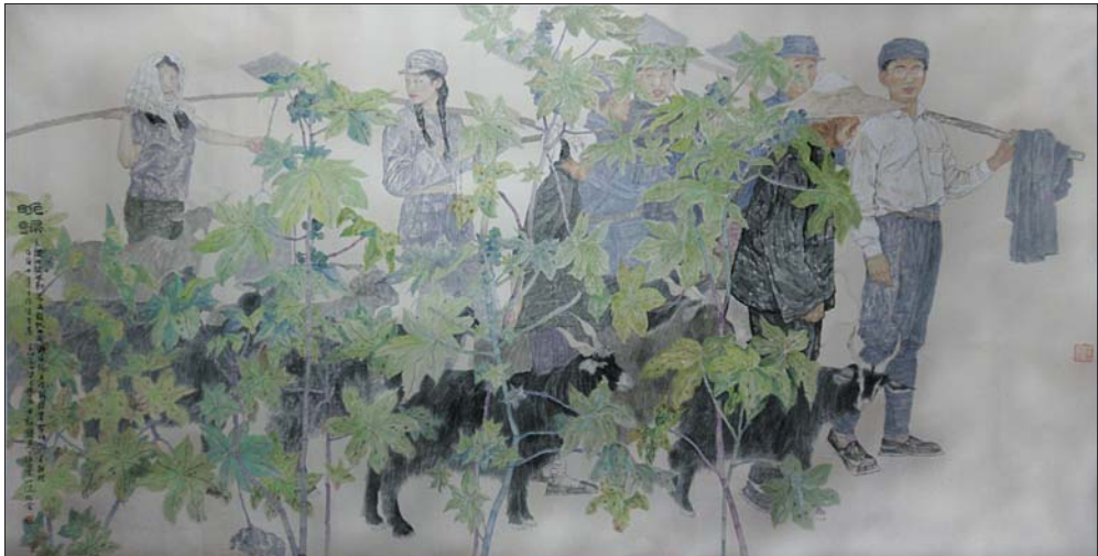
↑梁文博 中国画《晚归》