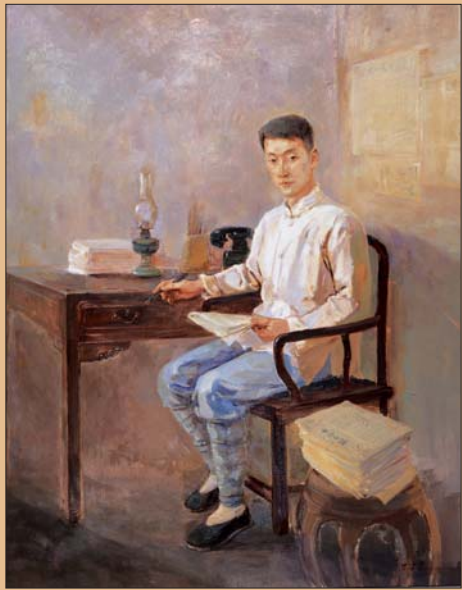
↑王玉萍 《革命烈士李竹如》 油画