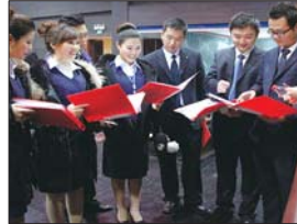
▲参与演出的农信社员工在做准备。

高雅的文艺活动,不仅提升了市民文化品位,扩大了菏泽农信社的社会形象,更展现了一个蓬勃发展的和谐农信。