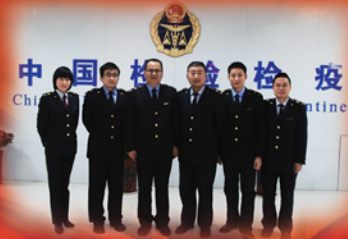
技术中心工作人员向全市人民拜年

科学的管理、先进的设备以及高素质的检测人员奠定了技术中心雄厚的技术力量。中心检测范围涵盖农药残留、兽药残留、植物疫病、重金属、食品添加剂、常规理化、微生物、羽绒羽毛等八大类涉550多个检测项目。年检测样品10000批次,项目数50000个。(闫秋成 张忠)