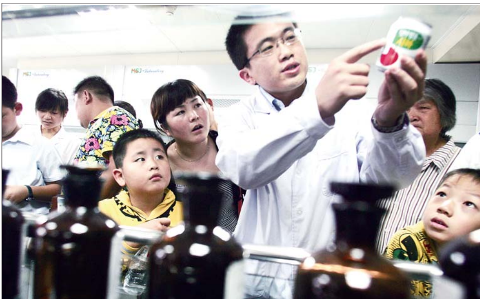
实验室工作人员为市民讲解如何辨别进口食品(资料片)。

第一站走进食品实验室,为避免活动流于形式,让市民参与其中,实验室的工作人员花了很多心思。筹备了几十种易被滥用的违禁食品添加剂和食品添加剂,市民常吃的蛋糕、牛奶等各类食品样本,又挑选染色杂粮、食用油等常用食材现场做实验。精心准备后,当天活动现场十分火爆,一家三口、上班族、大学生还有从