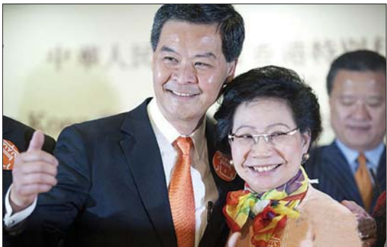
综合新华社香港3月25日电 香港特别行政区第四任行政长官选举结果25日揭晓。现年57岁的梁振英获得689张有效票,当选为香港特区第四任行政长官人选。选举投票于当日上午9时至11时举行。主投票站及中央票站设于香港会展中心。行政长官选举委员会1132位委员以无记名方式,就梁振英、何俊仁和唐英年三名合格候选人进行投票。香港特区选举管理委员会不久前公布,这次选举,候选人在任何一轮投票中取得超过600票有效票,该候选人即成为此次选举的胜出者。胜出者成为香港特区第四任行政长官人选,由中央人民政府任命。 12时34分,香港特区选举管理委员会负责2012年行政长官选举的选举主任宣布,梁振英获得689票,得票超过600张有效票当选。唐英年获得285票,何俊仁获得76票。整个选举过程在香港特区选举管理委员会及候选人的监票代理人、公众及媒体的监督下进行。 选举结果宣布后,梁振英举行记者会发表感言。他说,感谢选委的信任和市民的支持,给自己在未来五年服务香港、服务市民的机会。行政长官工作非常艰巨,自己将稳中求变、迎难而上,以谦卑感恩之心,担负起这分重大责任。他表示,相信只要大家目标一致、携手共进,就可以将香港建设成为一个更繁荣、更进步、更公义的社会。 根据《中华人民共和国香港特别行政区基本法》的规定,香港特区行政长官在当地通过选举或协商产生,由中央人民政府任命。第四任行政长官的任期自2012年7月1日至2017年6月30日。

□是第四任香港行政长官人选,“将稳中求变、迎难而上” □唐英年获得285票,何俊仁获得76票