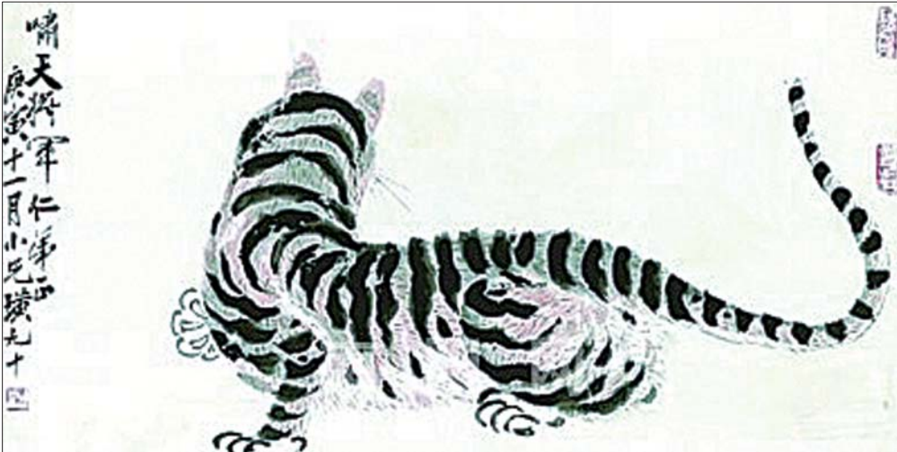
▲齐白石《虎》画在2010年香港苏富比春拍亮相，被疑赝品。