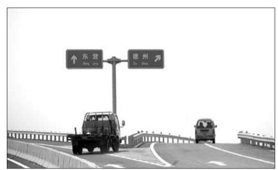
滨德高速尚未正式投入使用,不少机动车辆已经上路行驶。

据施工方负责人梁先生讲,滨德高速全线路面已铺设完毕,通车没有问题,但还有一些附属设施安装尚未完成,比如路边绿化和护栏安装。所有施工车辆都有相关部门发放的通行证,可以正常上路,其他车辆是被禁止的,因为会影响到正常施工,还有交通隐患。据了解,滨德高速公路初步预计5月底正式通车。