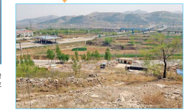
▲港沟收费站出口附近山体裸露,遍布建筑垃圾。