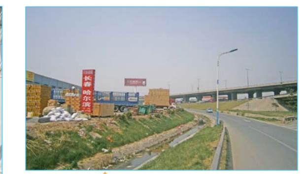
▲零公里高速下口附近,物流公司杂乱无章。