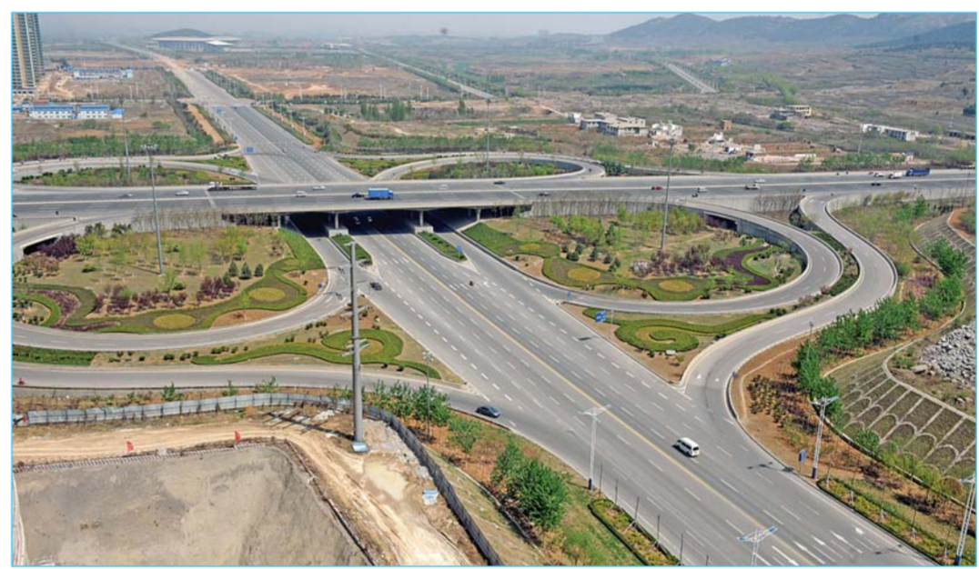
▲港西立交周围以高层建筑为主,组织城市公共空间和标志性景观。

“现在刚搞完拆除,看着有些乱,但项目完成之后将会起到不错的旅游观光作用。”程先生说,这个项目选在港沟,也是考虑到这里是济南南部公路的出入口,通过这个项目形成一个良好的绿色景观。历城区政府网上的信息显示,该项目包括种质资源保存区、试验研究综合区和试验繁育区。“这个项目是2010年批准的,马上就要开工了,预计到2013年完成主体工程,2014年将完全竣工交付。”一位项目负责人告诉记者。“等建成之后,景色应该不错。”